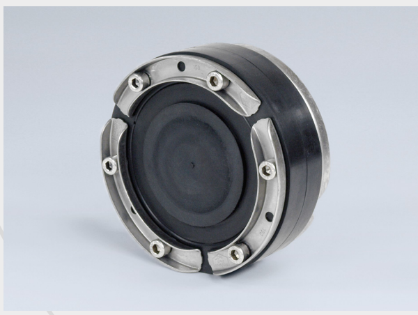
HSD 150-SSG 70-112 SL